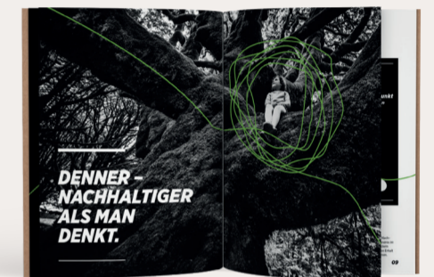
Die titelgebende grüne Linie zieht sich durch den gesamten Bericht.