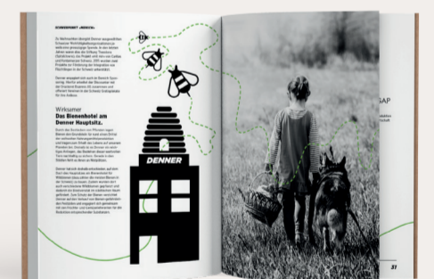
Ganzseitige Schwarzweiss-Fotografien emotionalisieren das Thema Nachhaltigkeit.

Die Weinkartone wurden von Denner Mitarbeitenden gesammelt, dann zugeschnitten und schliesslich im Siebdruckverfahren bedruckt.