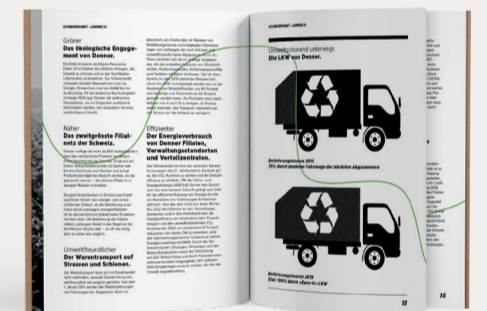
Reduzierte Icons illustrieren die wichtigsten Fakten.