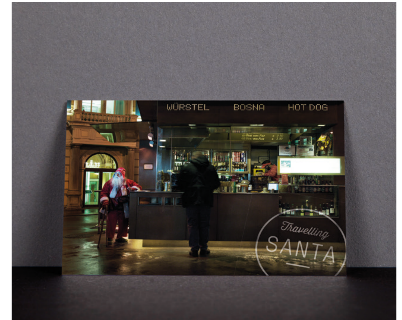
Freecards & Citylight