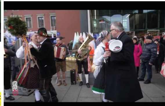
ORF „Gute Nacht Österreich“