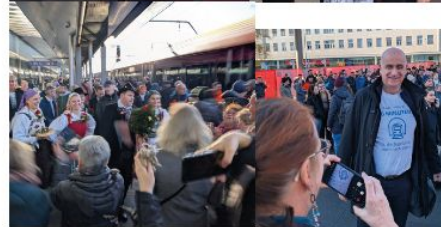
Beliebte Fotomotive in Graz, Klagenfurt und auf der Fahrt dazwischen.