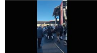
Krone.tv & Krone.at Live-Ticker

Die Villacher Bauernman überraschte vor der Eröffnung am Grazer Hauptbahnhof die Besucher mit einem Ständchen.