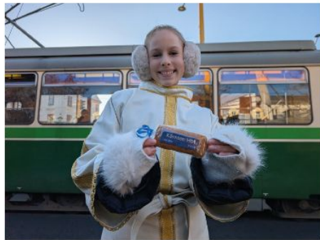
Das Christkind bei der Verteilaktion „Kärnten Hbf. Lebkuchen“.