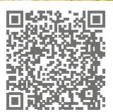
Mehr Angebote finden Sie hier