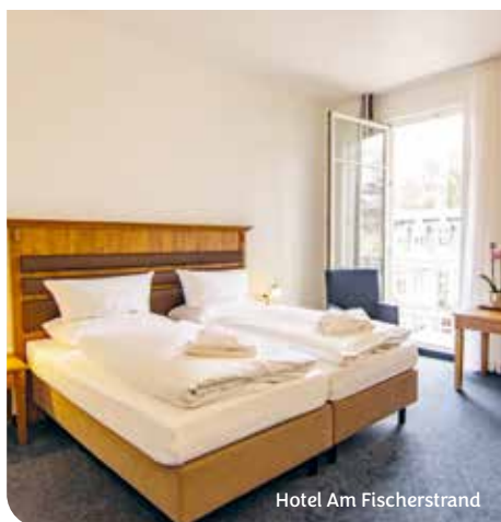
Hotel Am Fischerstrand