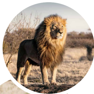
Die „Big 5“ Afrikas: Elefant, Löwe, Büffel, Nashorn, Leopard